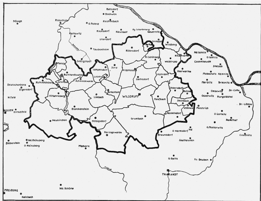
Abb. 1: Karte des Wiltsdruffer Landes.

verschiedener Herrschaftsträger aufeinander, die es im Folgenden genauer zu ermitteln und einzuordnen gilt. Da diese ihren Ausgang von Meißen und auch den Erzgebirgsausläufern um Freital und Tharandt nahmen – wie zu zeigen sein wird –, erstreckt sich das Arbeitsgebiet im Norden dicht oberhalb von Meißen nach Süden bis in die Tharandter Gegend, während es im Osten bis an den Rand des Altsiedellandes von Nisan und im Westen bis zur Triebisch reicht.