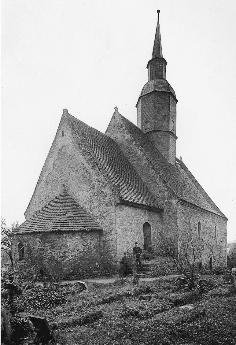
Abb. 2: Jakobikirche, Aufnahme von 1898.

sätzlich Einigkeit in der Forschung. 108 Im Detail sind jedoch viele Fragen offen; insbesondere über Alter, Zweck und vor allem Funktion der Jakobikirche wird viel spekuliert, ohne dass bislang eine wirklich überzeugende Antwort gegeben worden wäre.